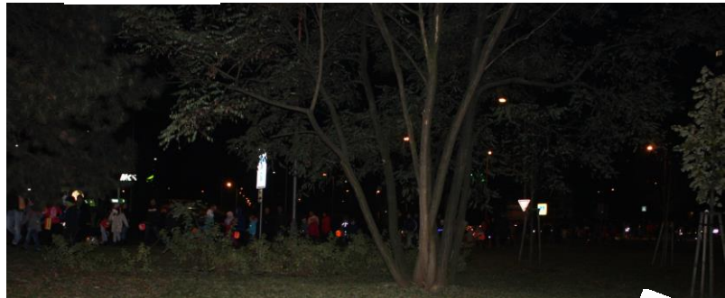
Fotografka už byla v parku a průvod u autobusové zastávky. ☺