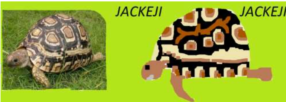
Tereza Bůžková 5.B