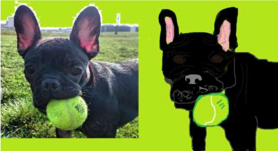
Lucie Levingerová 5.B

V hodinách informatiky se žáci snažili pomocí PC napodobit portrét svého mazlíčka co nejvěrohodněji.